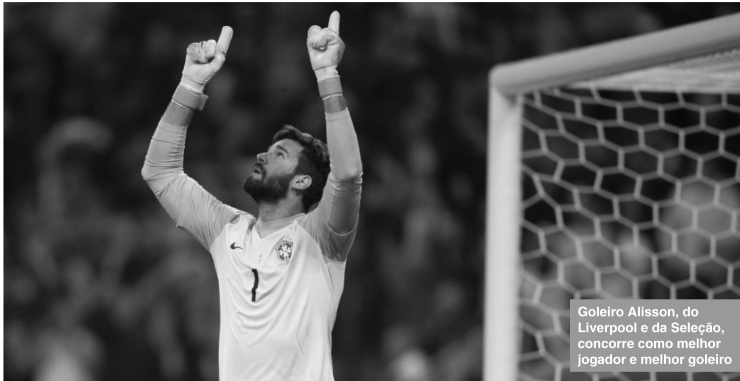
Goleiro Alisson, do Liverpool e da Seleção, concorre como melhor jogador e melhor goleiro